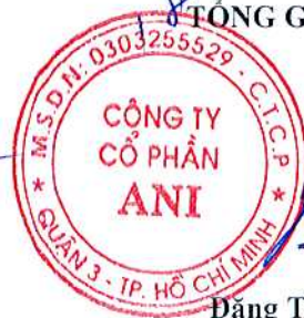
Đặng Tất Thành