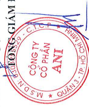
Đặng Tất Thành