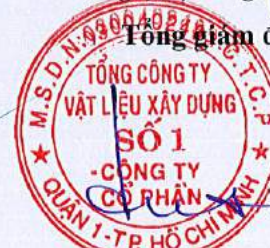
Nguyễn Xuân Thắng