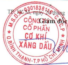
Đoàn Đắc Học