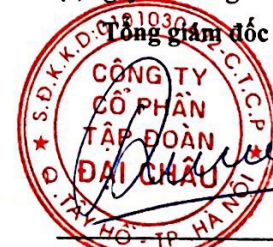
Đường Đức Hoà