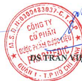
TRẦN VIỆT TRUNG