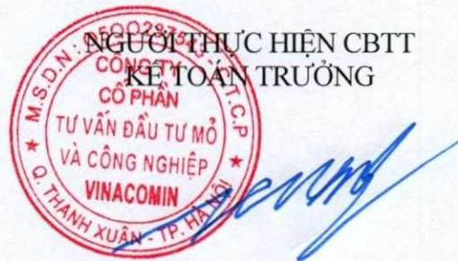
Phùng Đức Trường