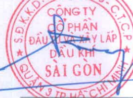
ĐOÀN TRUNG BÌNH