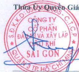
ĐOÀN TRUNG TÌNH