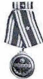
Huân chương Độc lập Hàng Ba