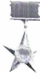
Anh hùng LLVT Nhân dân