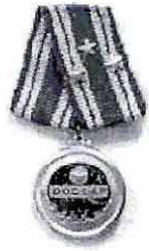
Huân chương Độc lập Hàng Nhất