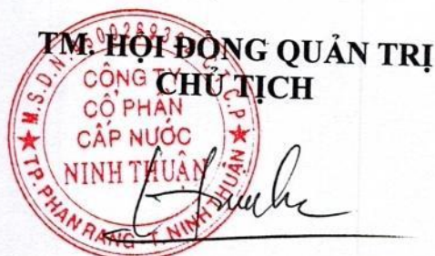
Phạm Hữu Sơn

9. Thẻ lệ làm việc và biểu quyết này được đọc trước Đại hội đồng cổ đông và lấy ý kiến biểu quyết của các cổ đông. Nếu được Đại hội đồng cổ đông thông qua với tỷ lệ từ 65% tổng số phiếu biểu quyết của tất cả cổ đông dự họp trở lên, Thẻ lệ này sẽ có hiệu lực thi hành bắt buộc đối với tất cả các cổ đông.