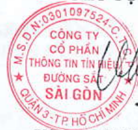
Uông Nhật Phương