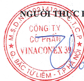
Vũ Thành Kiên