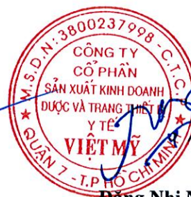
Đặng Nhị Nương