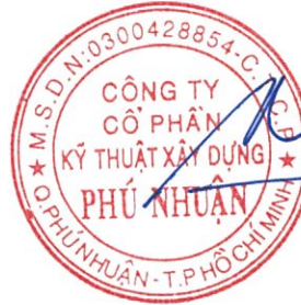
DƯƠNG DŨNG NHÂN