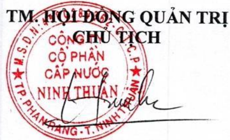
Phạm Hữu Sơn

9. Thể lệ làm việc và biểu quyết này được đọc trước Đại hội đồng cổ đông và lấy ý kiến biểu quyết của các cổ đông. Nếu được Đại hội đồng cổ đông thông qua với tỷ lệ từ 65% tổng số phiếu biểu quyết của tất cả cổ đông dự họp trở lên, Thể lệ này sẽ có hiệu lực thi hành bắt buộc đối với tất cả các cổ đông.