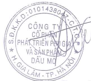
Hoàng Trung Dũng

(Các thuyết minh từ trang 10 đến trang 39 là bộ phận hợp thành của Báo cáo tài chính tổng hợp này)