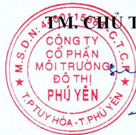
Đỗ Văn Sung