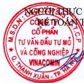
Phùng Đức Trường