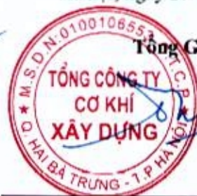
Đào Đức Thọ