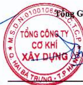
Đào Đức Thọ