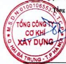
Đào Đức Thọ