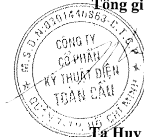
Tạ Huy Phong