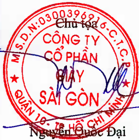
Chủ tịch Nguyễn Quốc Đại

Biên bản kiểm phiếu biểu quyết tại Đại hội đồng cổ đông thường niên năm 2020 - Công ty cổ phần Giấy Sài Gòn được lập vào lúc 10 giờ 00 phút cùng ngày và đã thông qua trước Đại hội. Đại hội nhất trí 100% và không có ý kiến gì khác./