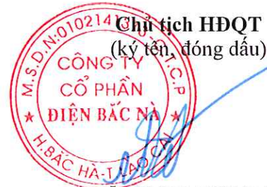
ĐẶNG QUANG ĐẠT