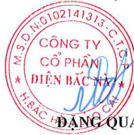
ĐẶNG QUANG ĐẠT