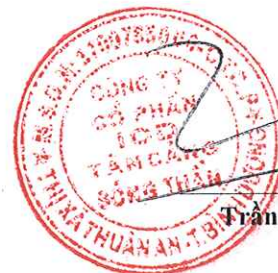
Trần Trí Dũng