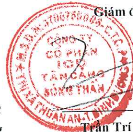
Trần Trí Dũng