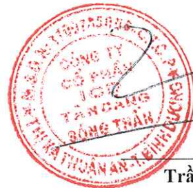
Trần Trí Dũng