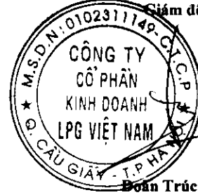
Đoàn Trúc Lâm