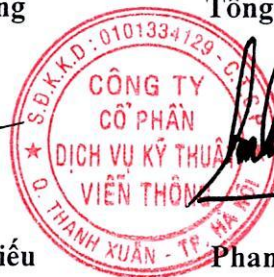
Phan Sỹ Kiên

Chứng chỉ ISO 9001:2008 (được cấp bởi TUV-NORD ngày 10/04/2014).