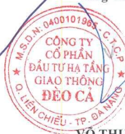
VÔ THỤY LINH