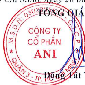
Đặng Tất Thành