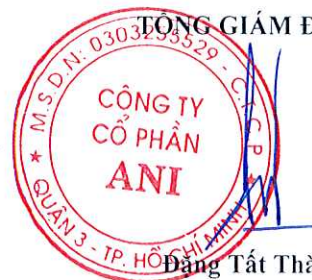
Đặng Tất Thành