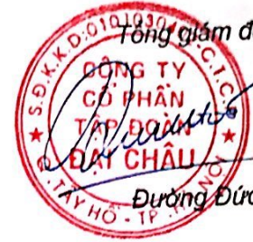
Đường Đức Hóa