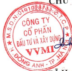
Đỗ Huy Hùng