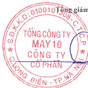
Thân Đức Việt