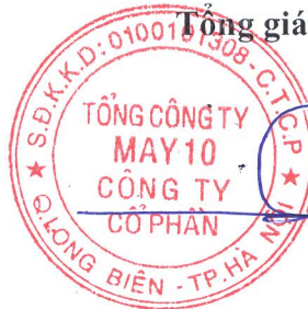
Thân Đức Việt