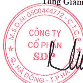
Phạm Trường Tam

(Các thuyết minh này là bộ phận hợp thành của Báo cáo tài chính)