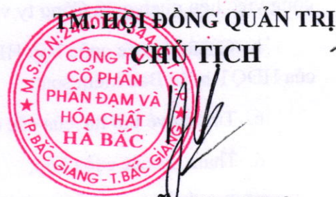
Nguyễn Văn Thiệu