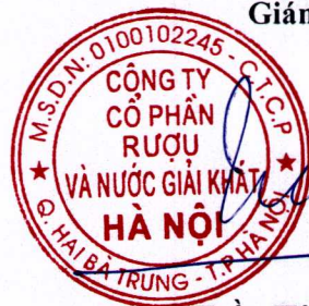
Trần Hậu Cường