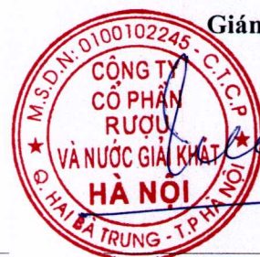
Trần Hậu Cường