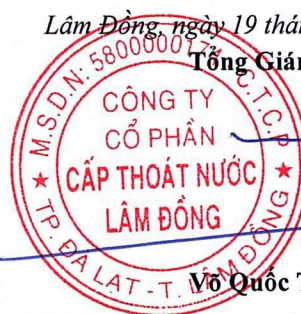
Võ Quốc Trang