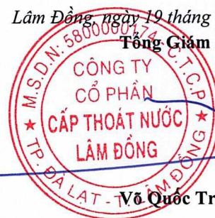
Võ Quốc Trang