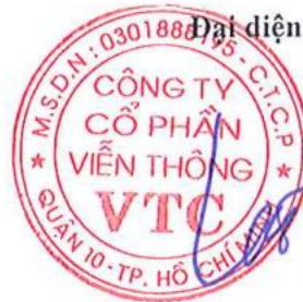
LÊ XUÂN TIẾN