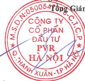
Đỗ Duy Điền