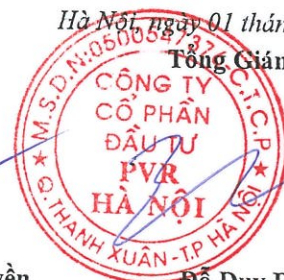
Đỗ Duy Điền