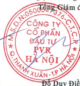
Đỗ Duy Điền