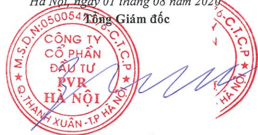
Đỗ Duy Điền