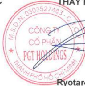
Ryotaro Ohtake Chủ tịch Hội đồng Quản trị