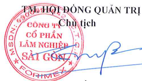
Phạm Việt Dương

Hội đồng Quản trị kính trình Đại hội đồng cổ đông thông qua danh sách bầu bổ sung thành viên độc lập Hội đồng Quản trị nhiệm kỳ 2019 - 2024 như trên./.