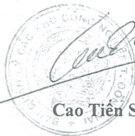
Cao Tiên Sỹ