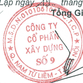
Trần Thạch Tân