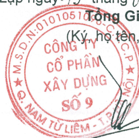
Trần Thạch Tân