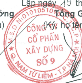
Trần Thạch Tân