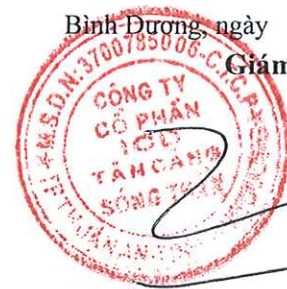
Trần Trí Dũng