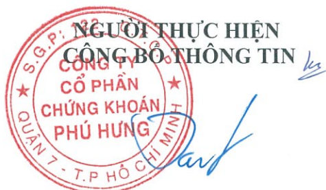
Ông CHEN CHIA KEN