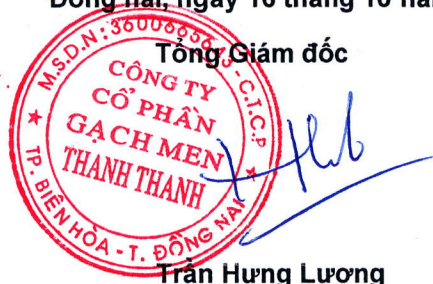
Trần Hưng Lương