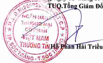
Hồ Phan Hải Triều