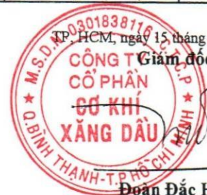
Đoàn Đắc Học