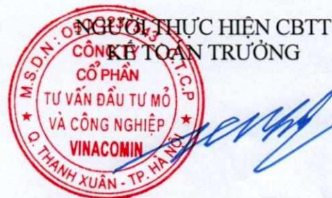
Phùng Đức Trường