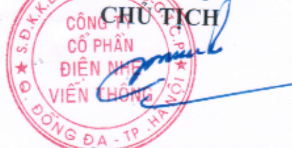
NGÔ TRỌNG VINH