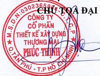
TRẦN MINH TRÚC