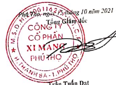
Trần Tuấn Đạt