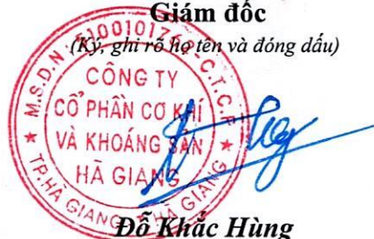
Đỗ Khắc Hùng