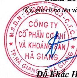
Đỗ Khắc Hùng