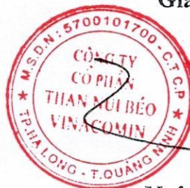
Ngô Thế Phiêt